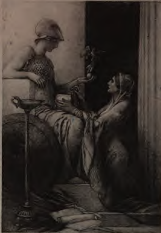
LELAND STANFORD JUNIOR UNIVERSITY